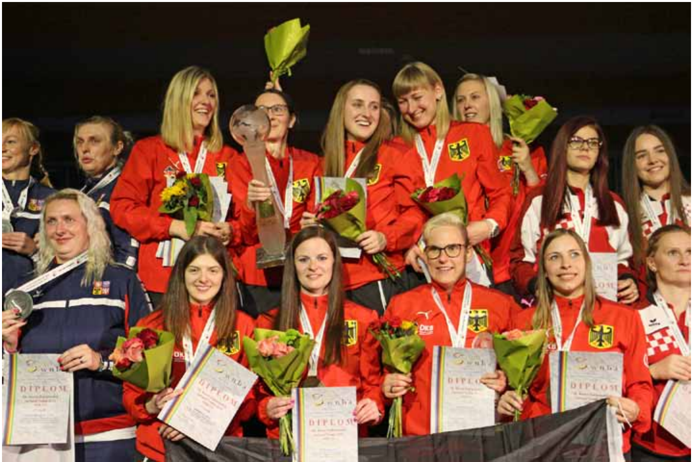
Die Deutschen Frauen am Ziel ihrer Träume.