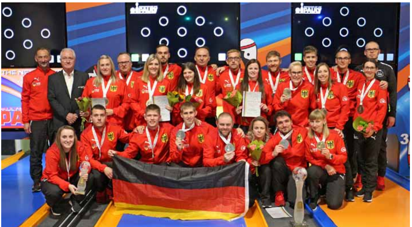
Die ganze deutsche Delegation in Polen.